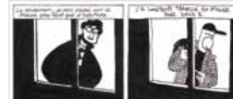
© David B & Lewis Trondheim

En janvier 2010, la Cité présentera 100 pour 100 , une exposition entre mémoire et création contemporaine. Le Musée de la bande dessinée a invité des auteurs du monde entier à choisir une planche de ses collections et à dessiner à leur tour une planche qui fasse écho aux chefs-d'œuvre de ce Panthéon. Découvrez, en avant-première quelques-unes de ces "résonances" : Elzie Crisler